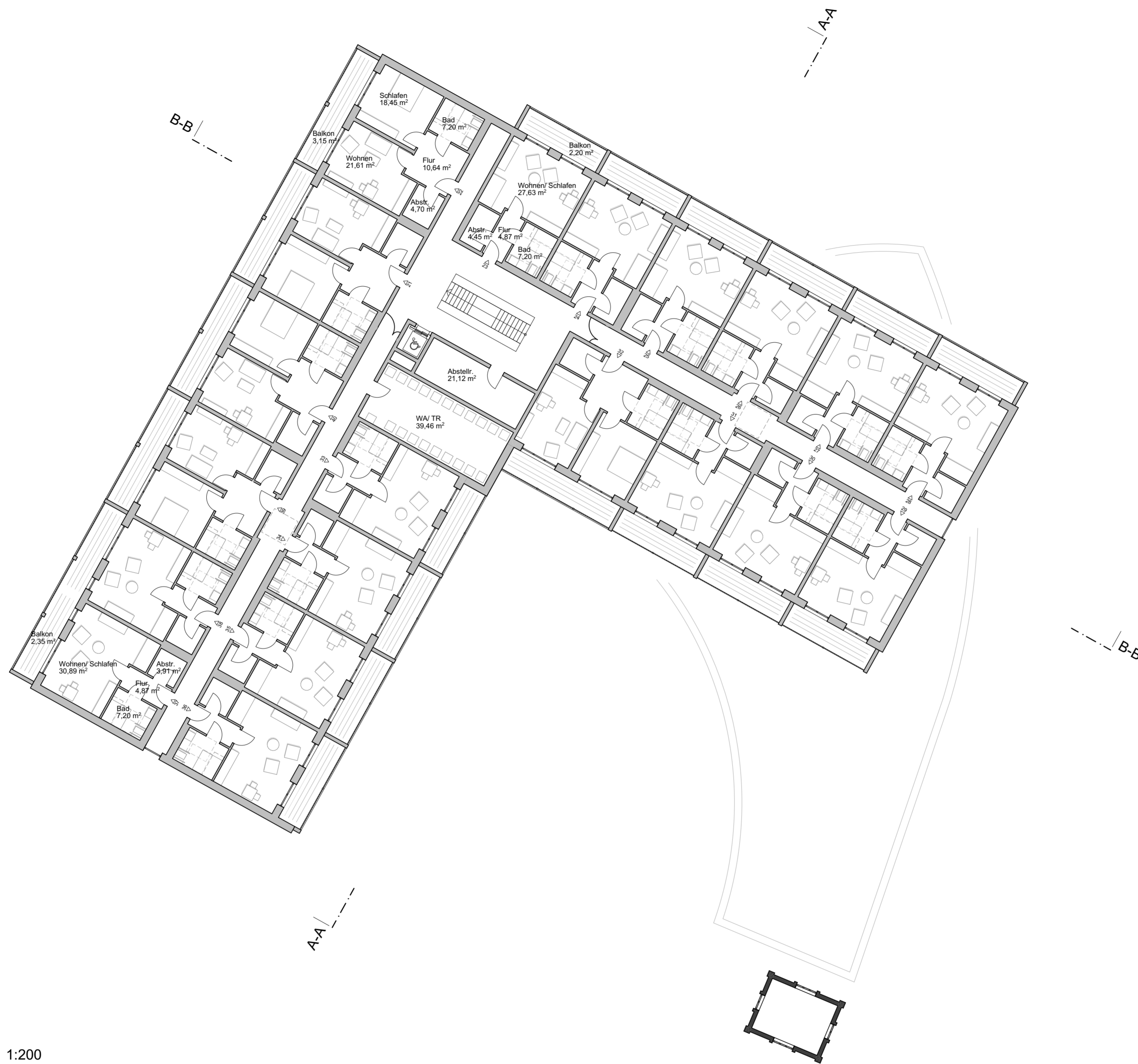
2. OBERGESCHOSS 1:200