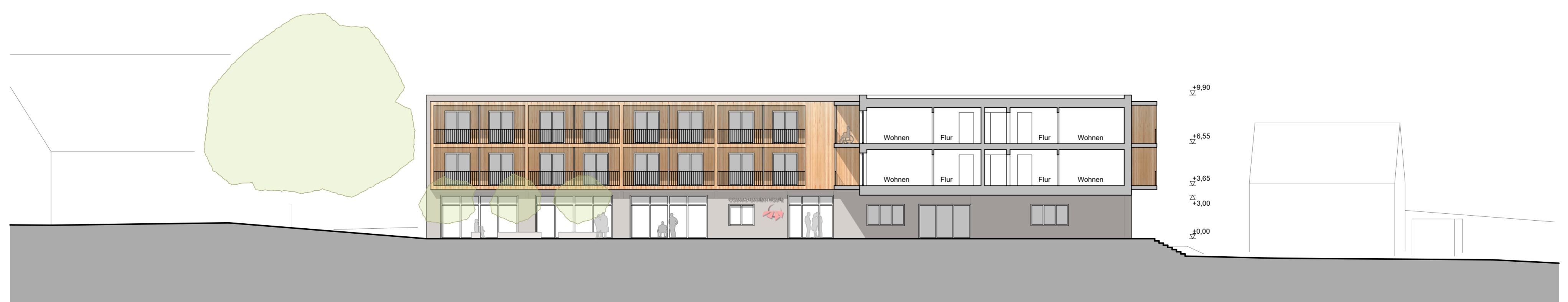
SCHNITT A-A 1:200