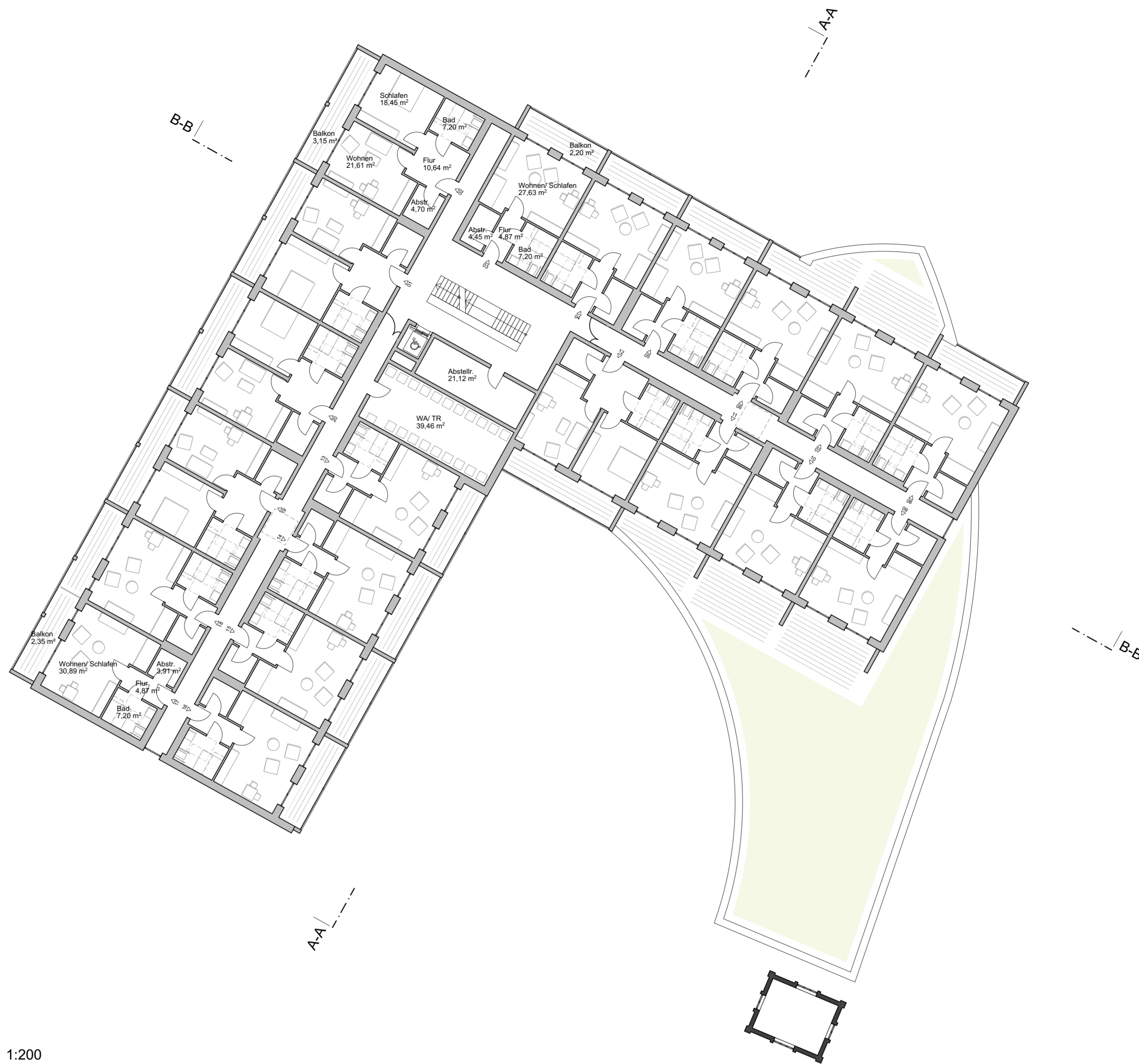
1. OBERGESCHOSS 1:200